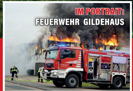
IM PORTRAIT: FEUERWEHR GILDEHAUS