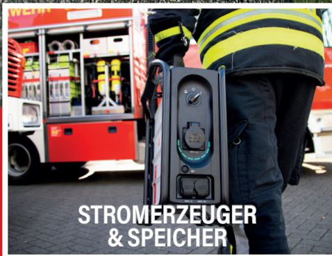
STROMERZEUGER & SPEICHER