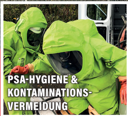
PSA-HYGIENE & KONTAMINATIONS- VERMEIDUNG

RETTmobil international Fulda RETTMOBIL - DA WILL JEDER RETTER DABEI SEIN!